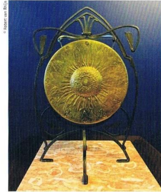
Gong designed by Victor Horta, ca. 1900 Gong dissenyat per Victor Horta, ca. 1900

Amsterdam School. The collection includes work by Émile Gallé, Louis Majorelle, Henry Van de Velde, H. P. Berlage and Walter Gropius, amongst others.