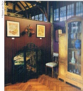
MUTEK is inside the Art Nouveau Haarlem Station El MUTEK és dins l'estació modernista de Haarlem

El MUTEK està ubicat en l'antiga sala d'espera per als viatgers de segona classe de l'estació ferroviària de Haarlem, construïda en estil modernista per Dirk Margadant entre 1906 i 1908. Les sales d'espera són obra de Jacob van den Bosch, dissenyador de mobiliari i interiorista. Amb bigues vistes, murals decoratius i vitralls, aquestes sales són un exemple clar de Modernisme holandès, un estil amb un lloc destacat en la col·lecció del MUTEK. La companyia ferroviària neerlandesa NS ha restaurat la decoració original de la sala i li ha retornat la seva antiga esplendor. www.mutekmuseum.nl