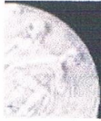
Amsterdamse School klok