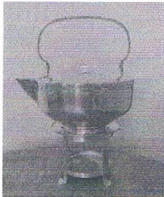
Wagons Lits bord