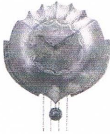
Art Deco kapstok