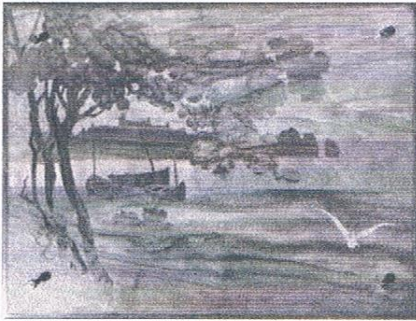
Vaas Fritz Heckert