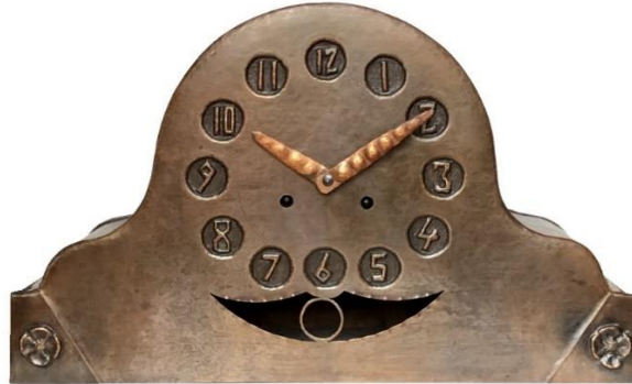
Amsterdamse School pendule ca. 1925