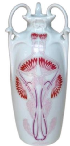
Aankoop Art Nouveau vaas Limoges circa 1910